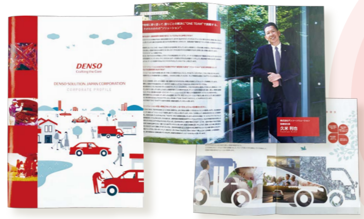
掲載ご協力：ミズノスポーツサービス株式会社 株式会社デンソーソリューション様